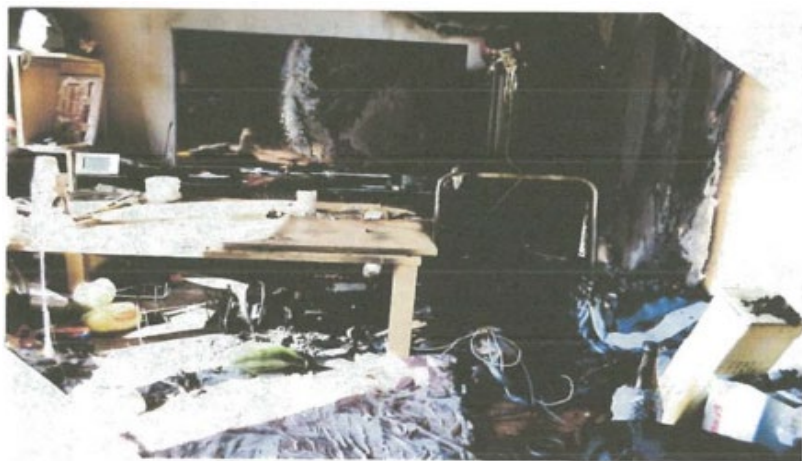
第2回デジタル・プラットフォーム企業が介在する 消費者取引における環境整備等に関する検討会 資料4